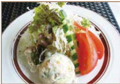
小谷流のグリーンサラダ 新鮮野菜を使用した1人前のサラダ盛合せ