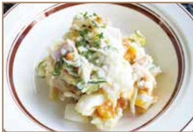
ポテトサラダ 洋食屋さんの手作り