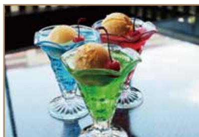
メロンクリームソーダ ブルーハワイクリームソーダ イチゴクリームソーダ