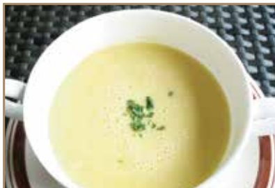
コーンポタージュスープ 味わいをお楽しみください。