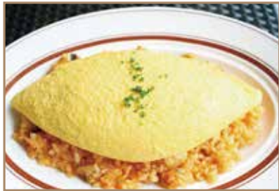
鯛の里特製 オムライス 千葉県産コシヒカリ、房総の赤卵を使用 ¥1,280