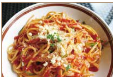
ナポリタン 昔懐かしい味わいです。 ¥1,200