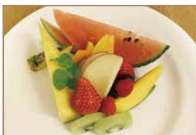
季節のフルーツ盛合せ 1人前の旬のフルーツ盛合せ