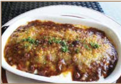
ミートソースと茸のドリア 自家製ミートソースとご飯 チーズの相性が抜群 ¥1,350