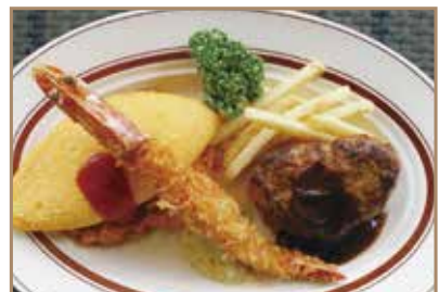
お子様プレート 1プレートに オムライス・ハンバーグ エビフライ・ポテトの盛合せ ¥1,650