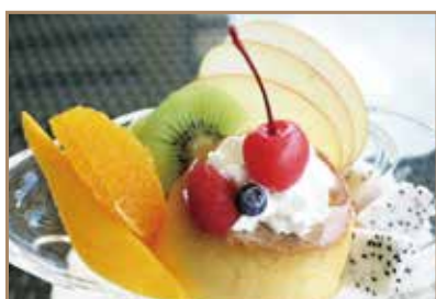
小谷流プリンアラモード 小谷流プリンと旬のフルーツの定番な1皿