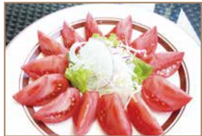
フルーツマトのサラダ 水分制限された高糖度のトマト