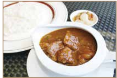
ビーフカレー コクのあるルーと やわらかいお肉が特徴です。 ¥1,400