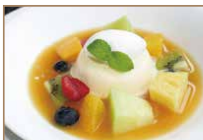
ババロア ババロアと旬のフルーツの定番な1皿